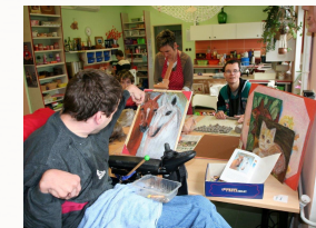
Výtvarný ateliér s keramikou